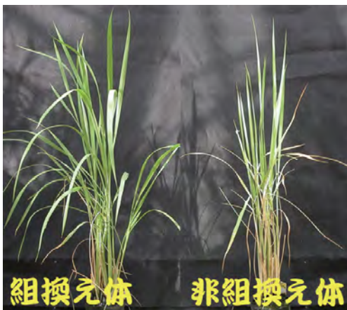
細胞壁成分を改変し、折れにくくなった組換えイネ