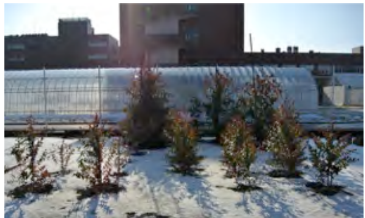
隔離ほ場（屋外）で実際に試験栽培中の寒さに強くなる遺伝子を導入したユーカリ

ストラップ作成キットプレゼント DNAは身近なもの！ 作ってみようDNAストラップ