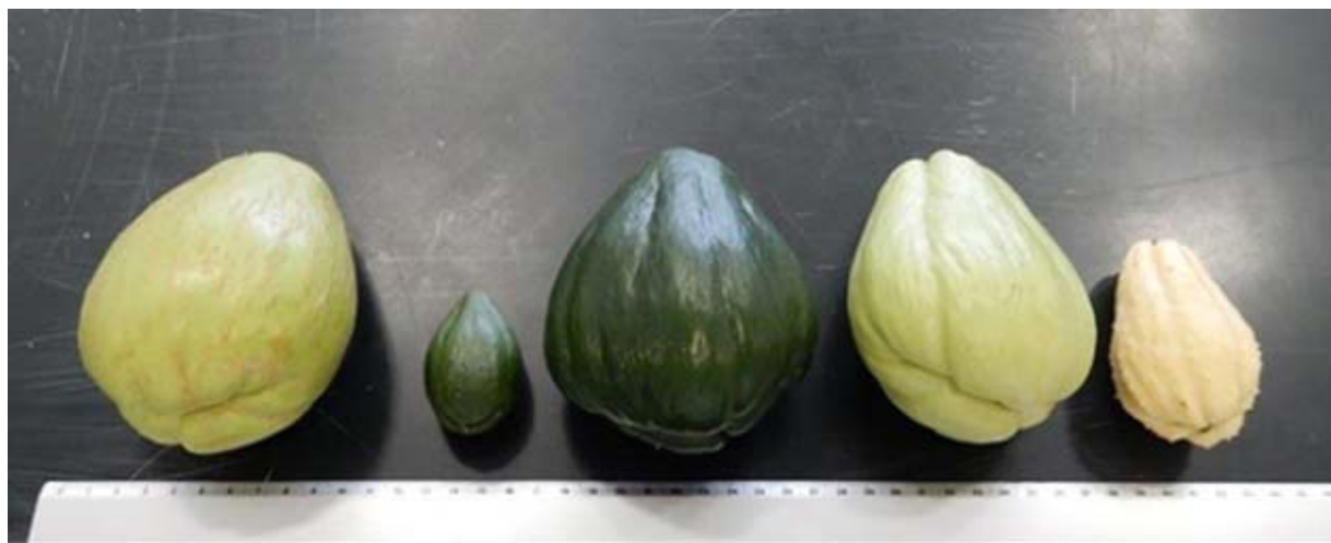
写真 日本への分譲が承認されたハヤトウリ(実際に分譲は果実丸ごとではなく、試験管内で組織培養された状態で行われる)

学名: Sechium edule 系統: 左から virens levis , nigrum minor , nigrum xalapensis , albus levis , albus dulcis (撮影者: 新野 孝男、撮影年月: 2016年8月、ものさし目盛: 1センチメートル)